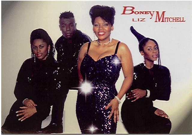
BONEY M (Mitchel)